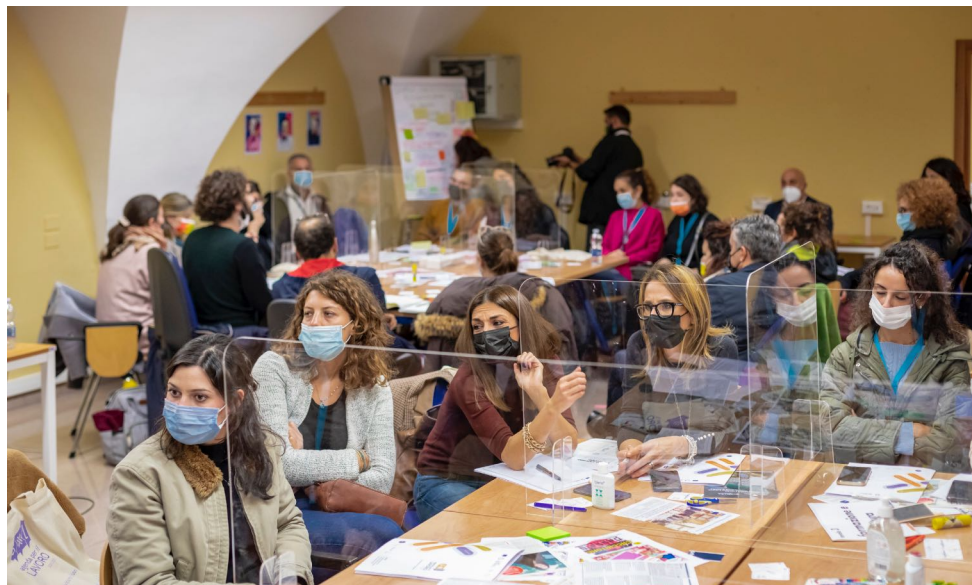
02_LECCE / 40 partecipanti