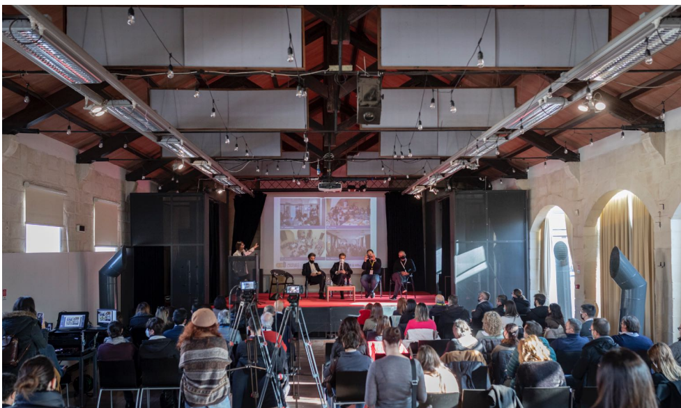
05_LECCE / 92 partecipanti