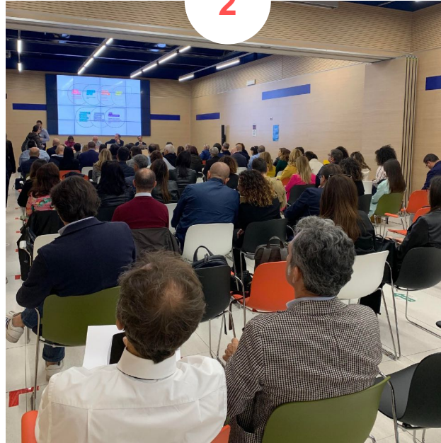
BARI Fiera del Levante 120 partecipanti ca.