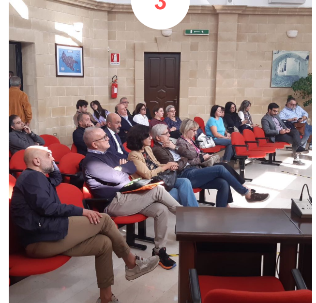
CASSANO DELLE MURGE Sala Consiliare 30 partecipanti ca.