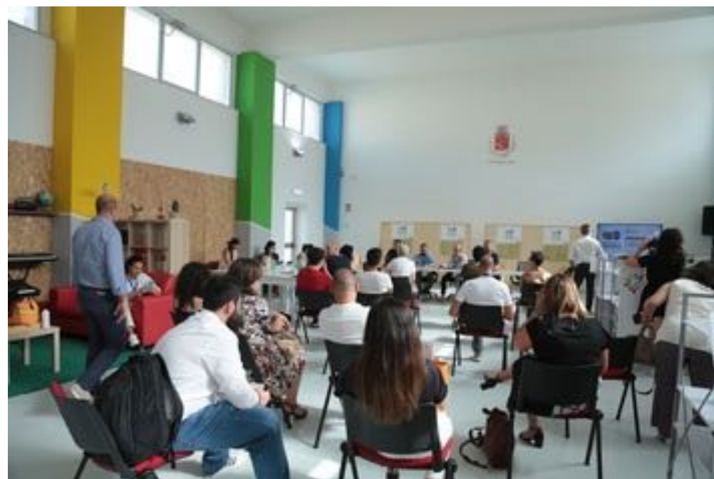
08_STORNARA / 38 partecipanti