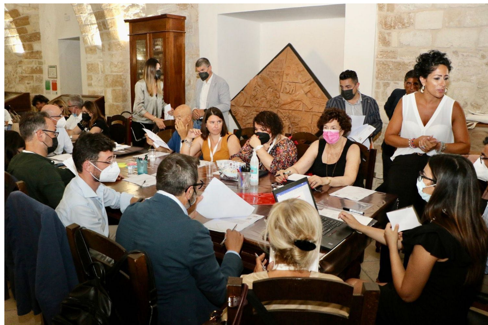
10_TARANTO / 84 partecipanti