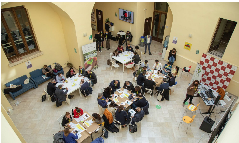
03_BRINDISI / 33 partecipanti