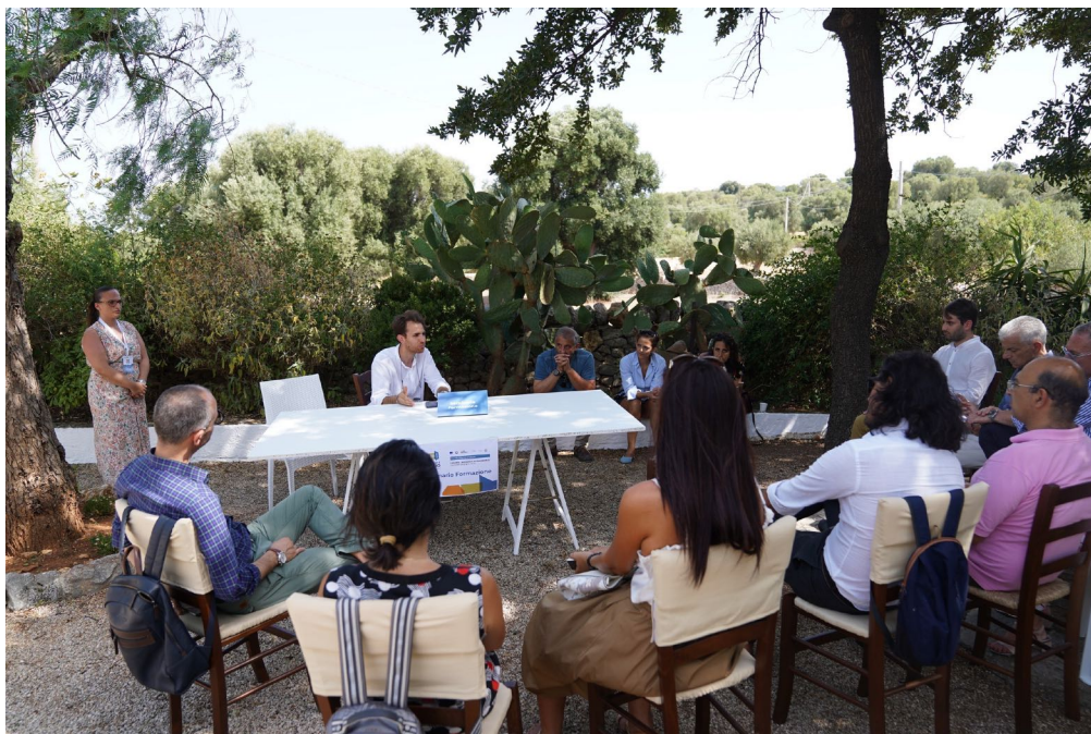
09_FASANO / 73 partecipanti