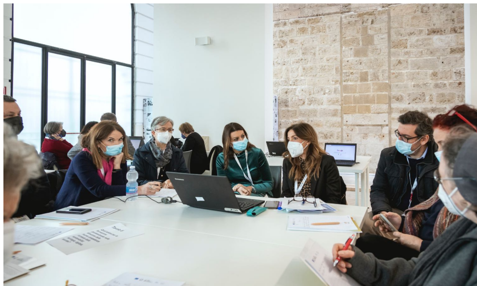
06_BARI / 36 partecipanti