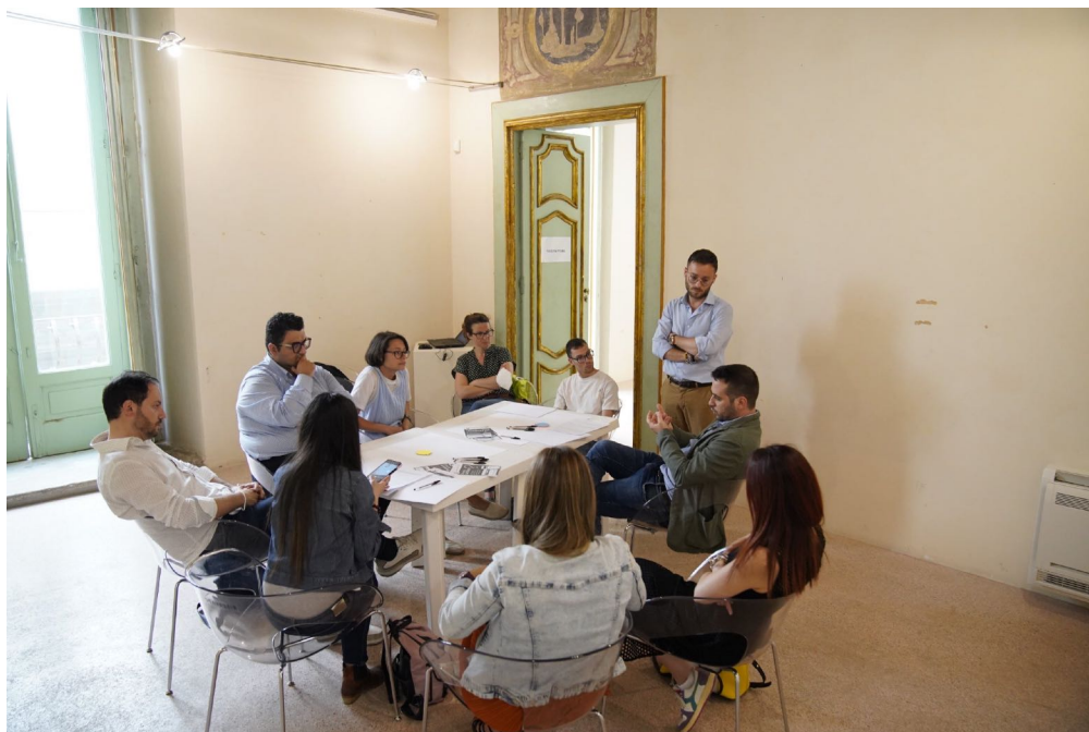
07_BISCEGLIE / 53 partecipanti