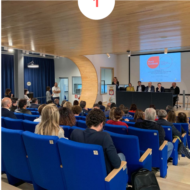
FOGGIA Biblioteca La Magna Capitana 90 partecipanti ca.