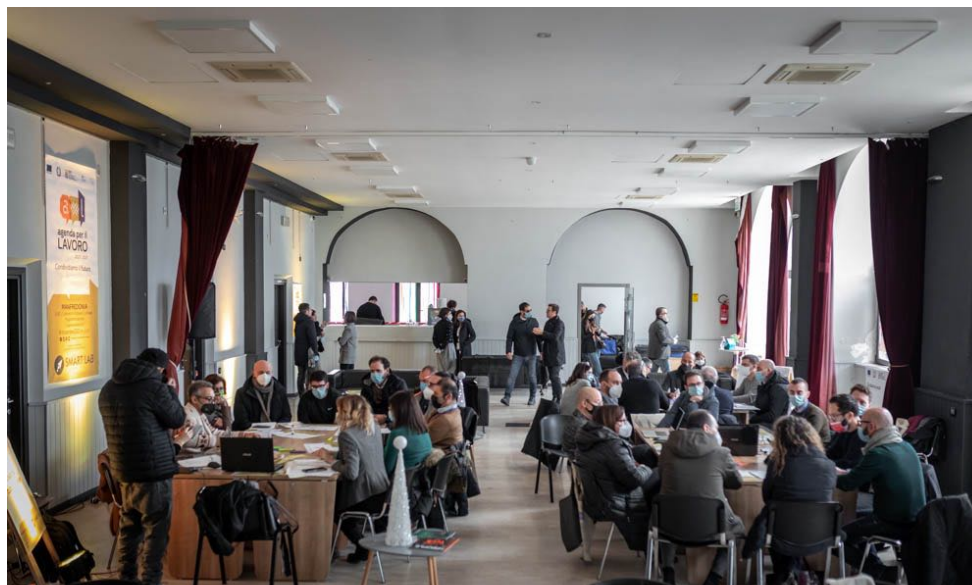
04_MANFREDONIA / 44 partecipanti