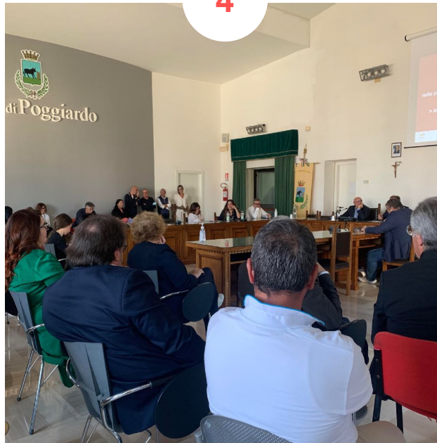
POGGIARDO Sala Consiliare 50 partecipanti ca.