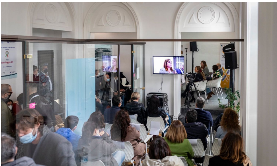
01_ALTAMURA / 87 partecipanti