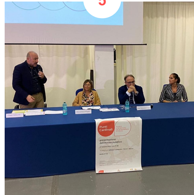
BARLETTA Istituto Cassandro-Fermi-Nervi 30 partecipanti ca.